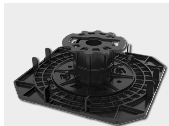
Lastverteilplatte + Verstellfuß BASE 3