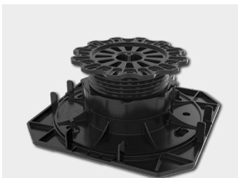
Lastverteilplatte + Verstellfuß PRO M