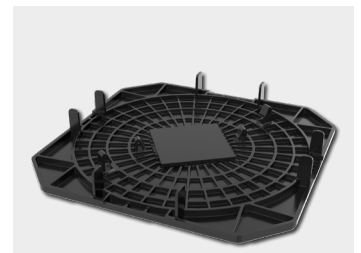
Lastverteilplatte + Rolli-Abstandhalter

*Mit den Verstellfüßen der Profi-Line außer dem PRO XXS und XS kompatibel.